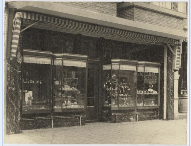
1932 De nieuwe winkel aan de Gedempte Gracht 16