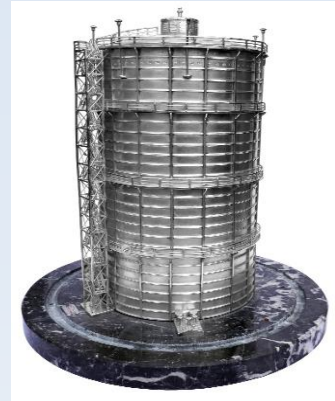
Zilveren model van de Zaanse gashouder, gemaakt door de firma S.I. Vet & Zn in 1930.