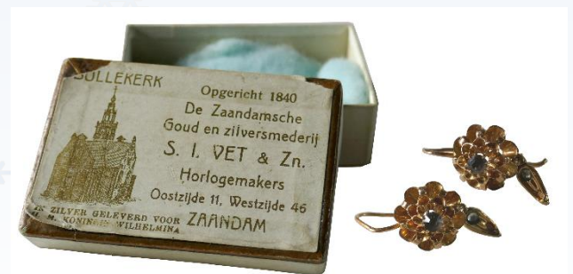
1908 Stel gouden oorhangers, gekocht in de winkel van S.I. Vet & Zn.